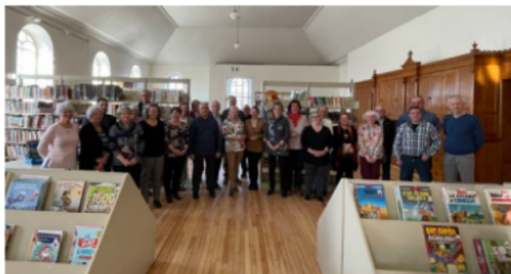
La bibliothèque Marie-Joseph Corrivaux de Saint-Vallier.