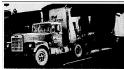
Le Courrier de Saint-Hyacinthe, 16 décembre 1970, Cahier B, page 2

Si ma mémoire est bonne, la première entreprise à en posséder une fut les Encans de la Ferme de la rue Saint-Louis. Les gens prirent réellement conscience de la faible hauteur du viaduc quand il s'engouffra sous celui-ci et que le toit de la semi-remorque s'enroula comme une boîte de sardines.