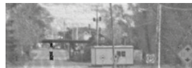
Ancien viaduc remplacé en 1977