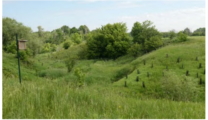
Ferme HL inc. - Saint-Hugues MRC des Maskoutains