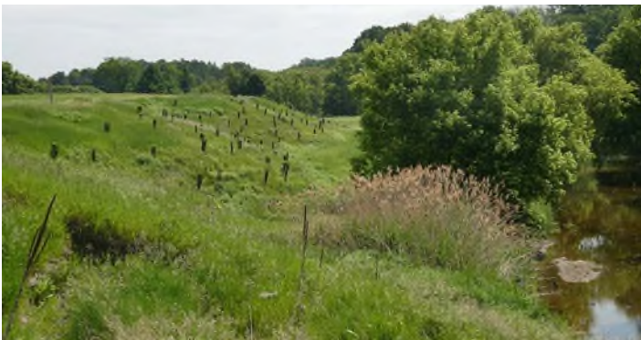
Ferme Hugo - Saint-Hugues MRC des Maskoutains