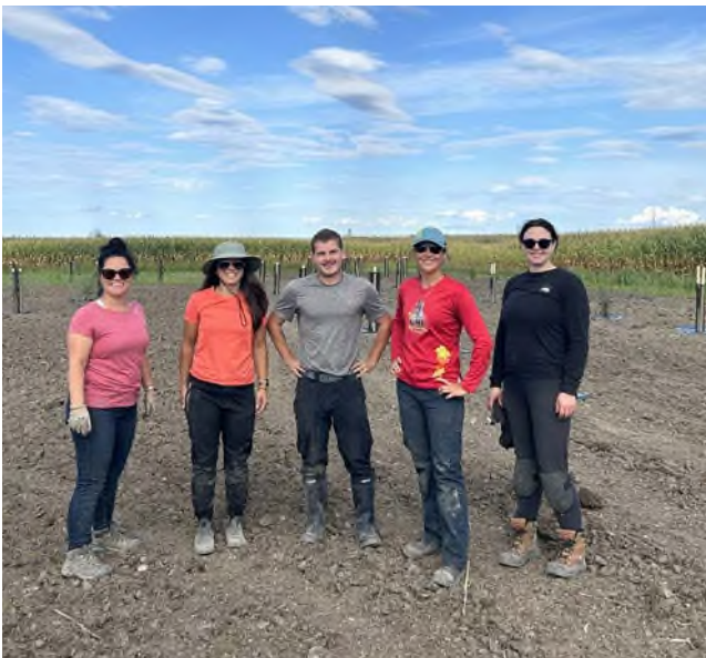
Les Fermes Cuerrier inc. - Saint-Zotique MRC de Vaudreuil-Soulanges