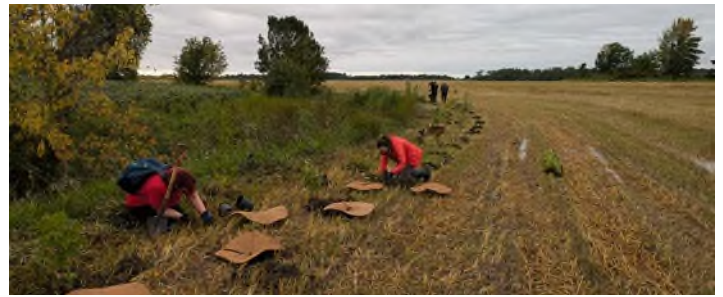
Aménagement d'une double haie arbustive - Les Fermes Erskine - Hinchinbrooke MRC du Haut-Saint-Laurent