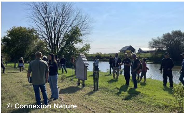
Journée champ du 4 septembre 2024 Ferme S.C.S. inc.

Cette année encore, le programme ALUS Montérégie s'est illustré à de nombreuses occasions. Nos représentants passionnés ont participé à plus de 15 événements, mettant en lumière le programme tout en valorisant les initiatives environnementales des productrices et producteurs agricoles. Ces événements se sont tenus dans le cadre d'activités telles que : rencontres informatives, journées champs, visites à la ferme et conférences.