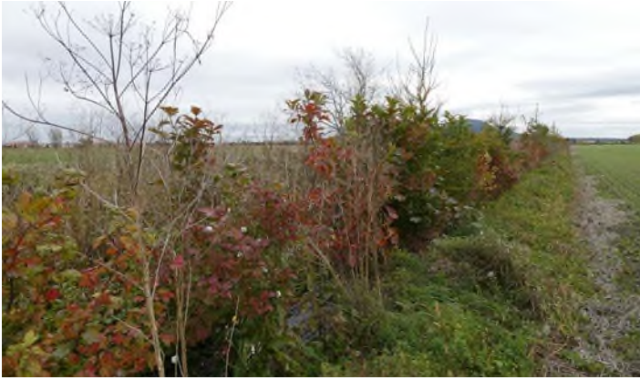
CEROM - Saint-Mathieu-de-Beloeil MRC de la Vallée-du-Richelieu

Ce sont 94 % des ententes de conservation des aménagements réalisés en 2019 qui ont été renouvelées pour une période de cinq ans, auprès de 30 productrices et producteurs agricoles. Cela représente une rétribution supplémentaire totale de 63675 $ sur 5 ans, qui permettra de préserver 18,58 hectares de terres agricoles entièrement dédiées à la biodiversité.