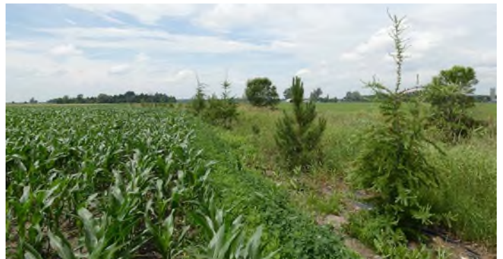
Ferme La Pampa inc. - Mont-Saint-Grégoire MRC du Haut-Richelieu