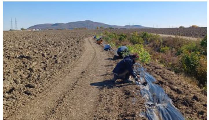
Ferme DG Noiseux 2013 inc. - Marieville MRC de Rouville