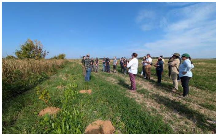
Journée champ du 20 septembre 2024 Les Fermes Erskine

De plus, le rayonnement des actions environnementales bénéfiques faites par les productrices et producteurs agricoles s'est matérialisé par l'installation de panneaux d'affichage chez quatre entreprises de la Montérégie.