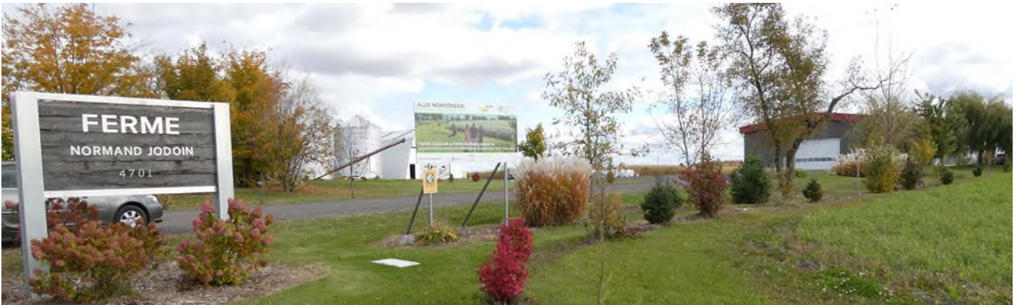
Ferme Normand Jodoin inc. - Varennes - MRC de Marguerite-d'Youville